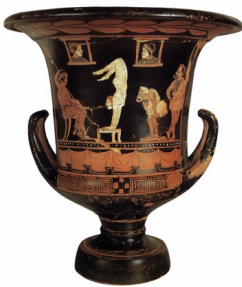
Cratère sicilien à figures rouges représentant Dionysos et des acteurs, 375-360 av. J.-C. , Lipari, Museo Archeologico Regionale Eoliano Luigi Bernabo Brea.

Venez et vous serez médusés par cette fascinante aventure !