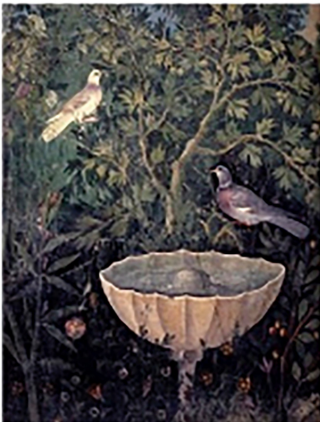
Pompéi, fresque de la maison du Bracelet d'or

Vous avez envie d'entrer en Faculté des lettres à l'Université de Lausanne (UNIL) ? Savez-vous que des connaissances de latin sont obligatoires pour étudier l'histoire, le français, le français médiéval, l'histoire ancienne, l'archéologie, l'italien, l'espagnol et la linguistique ? Si vous choisissez une de ces branches et n'avez jamais fait de latin, vous devrez suivre pendant deux ans un complément de formation donné dans des auditoires regroupant jusqu'à 40 élèves. Au Gymnase de Burier, vous avez la possibilité de suivre, dans une classe à plus petit effectif, un cours de langue et culture latines d'une durée de deux ans qui vous permettra d'obtenir une attestation vous dispensant du complément de formation exigé à l'Université.