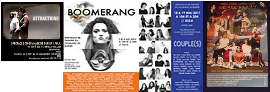
Affiches des spectacles 2016, 2017, 2018, 2019

L'objectif de ce cours est la création d'un spectacle. L'approche du cours est littéraire et thématique ; la phase de lecture est donc importante. Le thème du spectacle (mai 2024) sera déterminé au début de l'année scolaire 2023-2024.